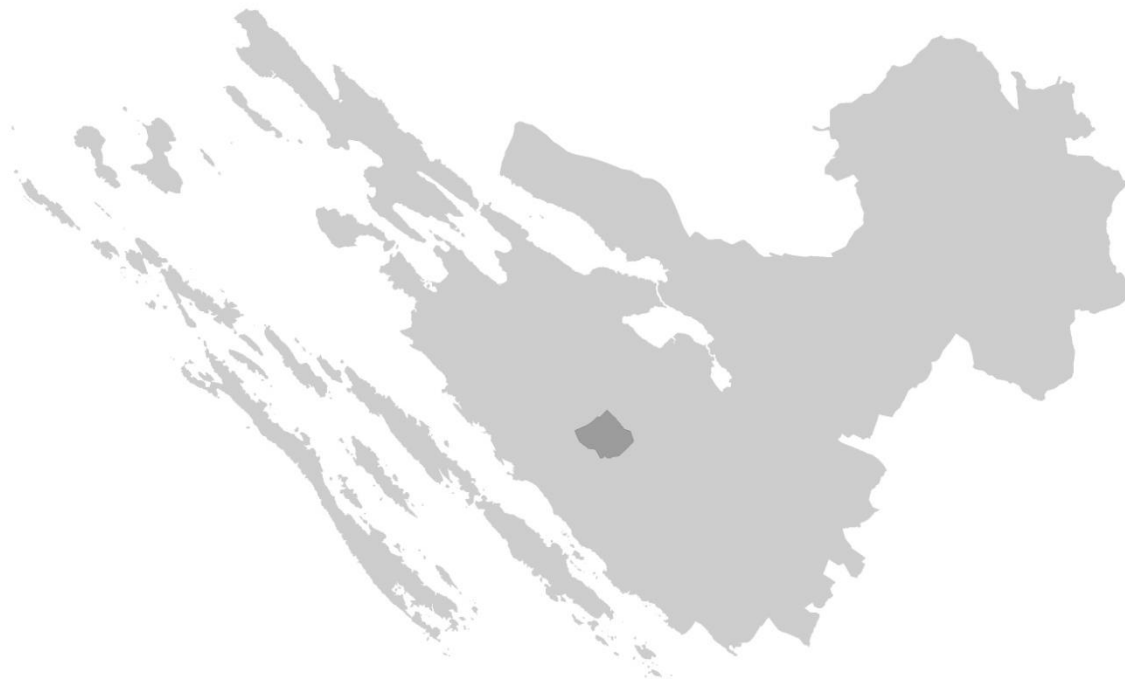
Slika 1. Geografski položaj Općine Škabrnja u Zadarskoj županiji

Popisom 2011. utvrđeno je 1776 stanovnika s gustoćom naseljenosti od 78,8 stan/km 2 . Usporedbom s prosječnom naseljenošću općina Zadarske županije (2408 stanovnika), Općina Škabrnja je ispod prosjeka, dok gustoćom naseljenosti premašuje prosjek općina (28,6 st/km 2 ) i Županije (46,6 st/km 2 ). Gustoća naseljenosti gotovo je istovjetna s državnom vrijednosti za ovaj demografski pokazatelj (78,4 st/km 2 ).